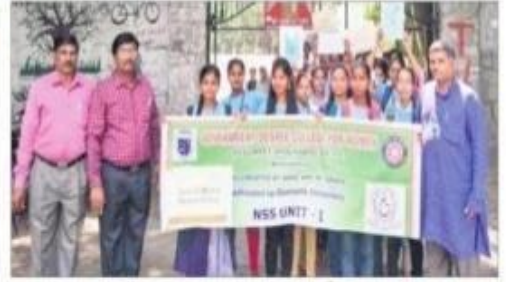
ర్యాలీ నిర్వహిస్తున్న బోగంపేట ప్రభుత్వ మహిళా డిగ్రీ కళాశాల విద్యాల్గినులు

Thu, 83 October 2019 https://epaper.sakshi.com/c/44272273