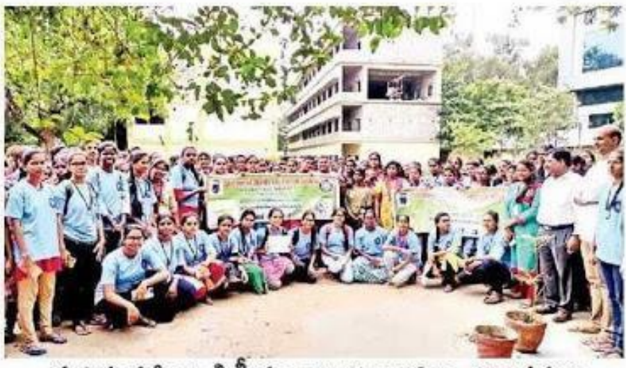
ప్రభుత్వ మహిళా డిగ్రీ కళాశాల విద్యార్థినులు, అధ్యాపకులు

బేగం పేట(అమీర్ పేట), న్యూస్ టుడే: నీటి పొదుపు, పర్యా వరణ పరిరక్ష ఇపై బేగంపేట లోని ప్రభుత్వ మహిళా డిగ్రీ కళాశాల విద్యా ర్థినులు శుక్ర వారం అవగా హన కార్య