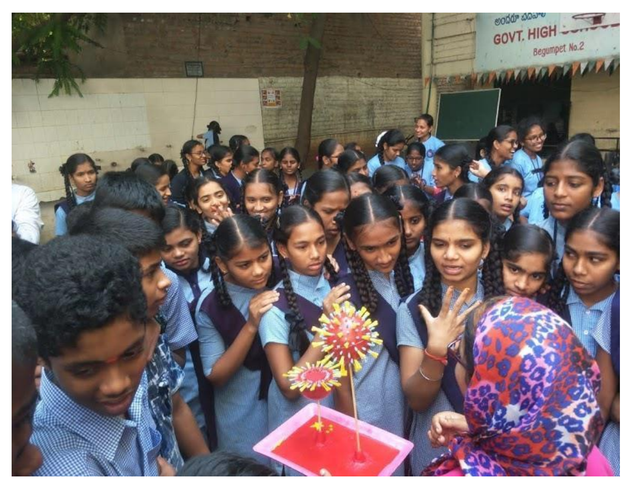
No. of students participated: 40