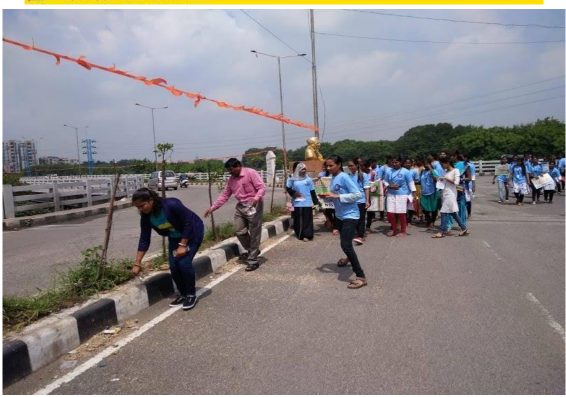
No. of volunteers participated: 20

Thu, 83 October 2019 https://epaper.sakshi.com/c/44272273